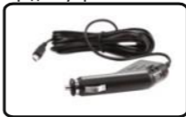
4) Автомобильное зарядное устройство