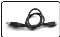
3) USB кабель